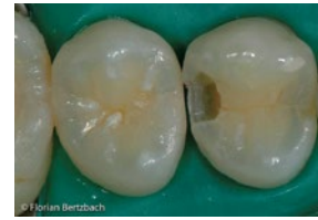
Präparation 14 od, Darstellung des Defektes