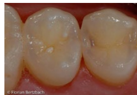
14 distal Verdacht auf Approximalkaries