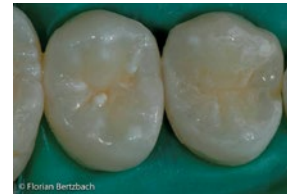
Fertig gestellte Compositfüllung 14 od