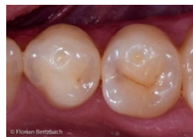
35 mesial Verdacht auf Approximalkaries