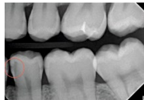
Röntgenbefund: 35 C3 mes