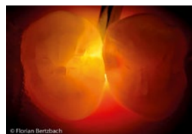
Transillumination: 14 distal, der dunkle Schatten zeigt die Schmelzläsion, der rote Halo gibt einen Hinweis auf die Ausdehnung der Dentinkaries